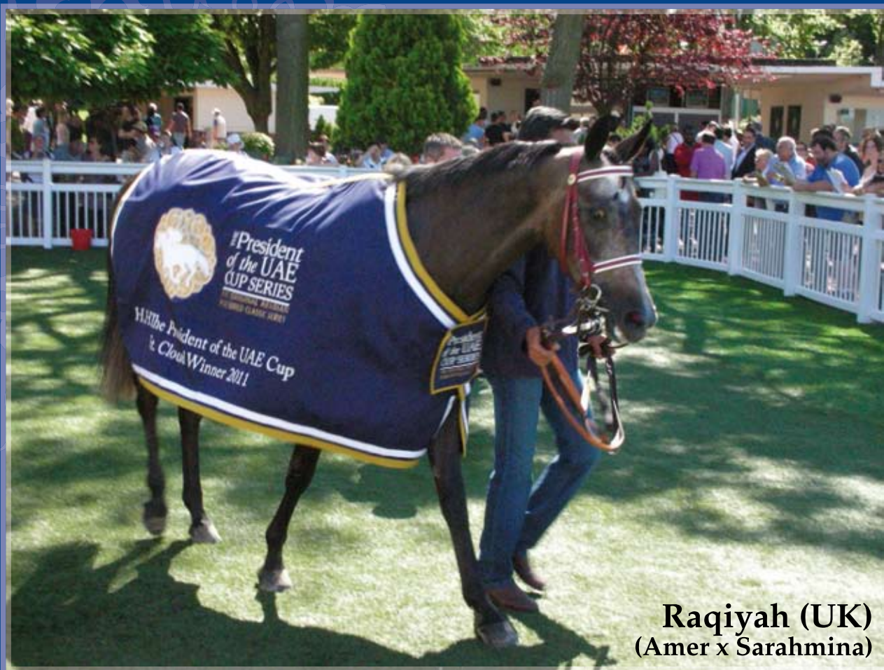
Raqiyah (UK) (Amer x Sarahmina)