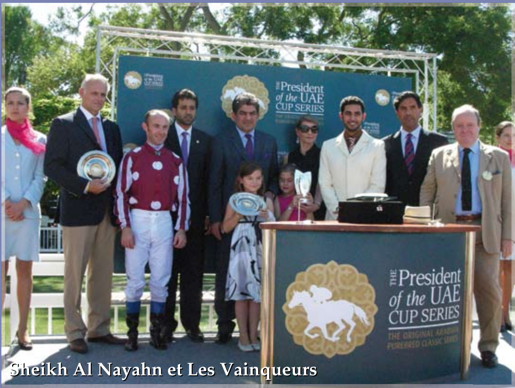
Sheikh Al Nayahn et Les Vainqueurs