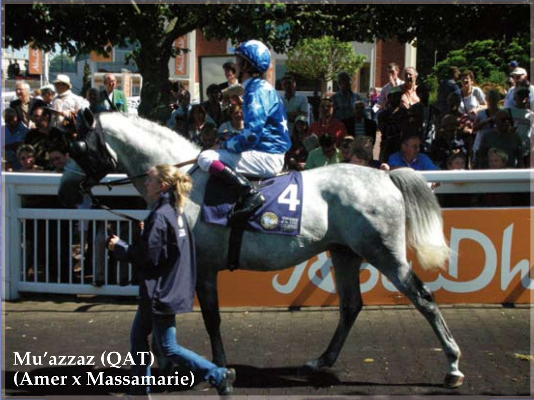
Mu'azzaz (QAT) (Amer x Massamarie)