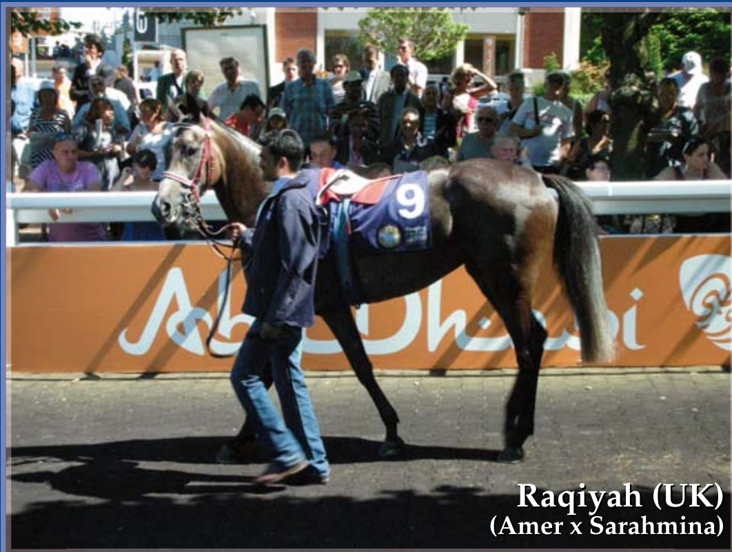
Raqiyah (UK) (Amer x Sarahmina)