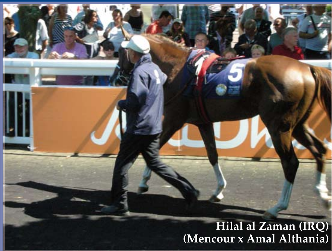
Hilal al Zaman (IRQ) (Mencour x Amal Althania)